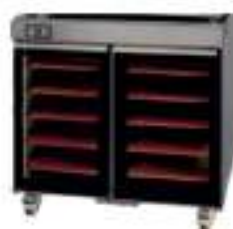
OPTION : Etuve vitrée OPTION : Glassed proofer