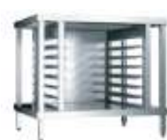
OPTION : support avec glissières OPTION : support with slides