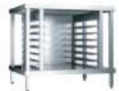
OPTION : support avec glissières OPTION : support with slides