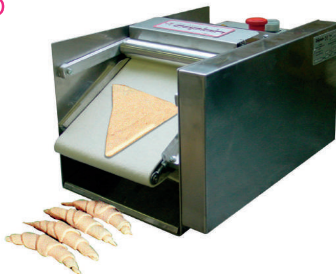
Table top machine