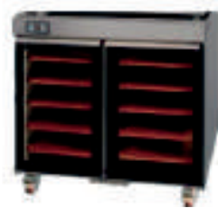
OPTION : Etuve vitrée OPTION : Glassed proofer