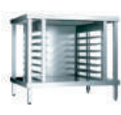
OPTION : support avec glissières OPTION : support with slides