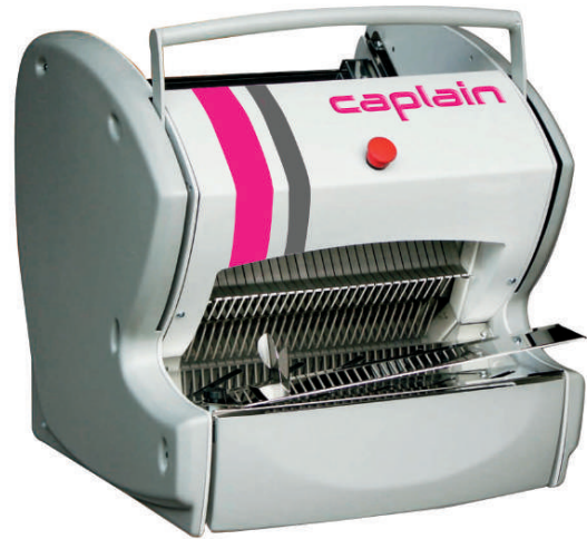
Table top model